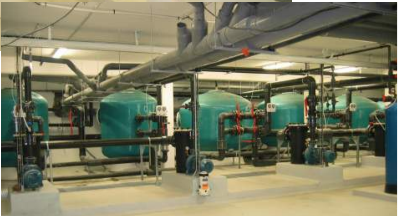
>>>> Mise en place des canalisations bassin extérieur

Viry Châtillon (91) Construction du stade nautique (5 bassins) Filtration à sable et hydro- anthracite 630 m3 / h (6 filtres) Année 2002